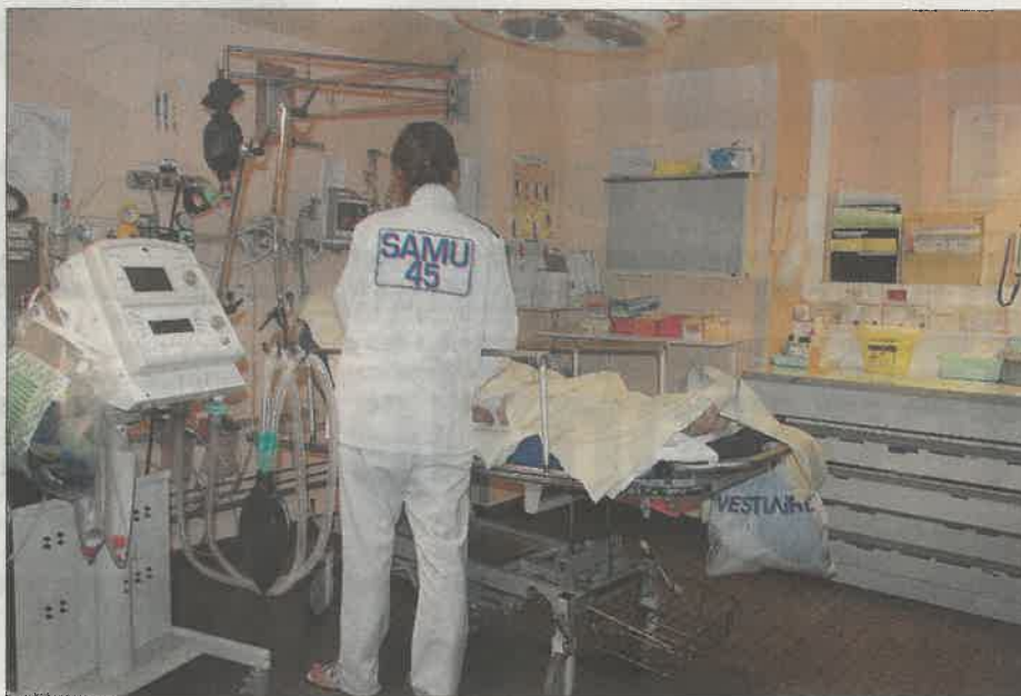
Le service des urgences va être entièrement réhabilité. Début des travaux en 2020.

Ce projet est aujourd'hui évalué à un peu plus de 23 millions d'euros, subventionné à hauteur d'un million d'euros par l'État, le reste étant financé par emprunt. « L'ARS a accepté le projet », explique Nadia Criton. « Celle-ci nous