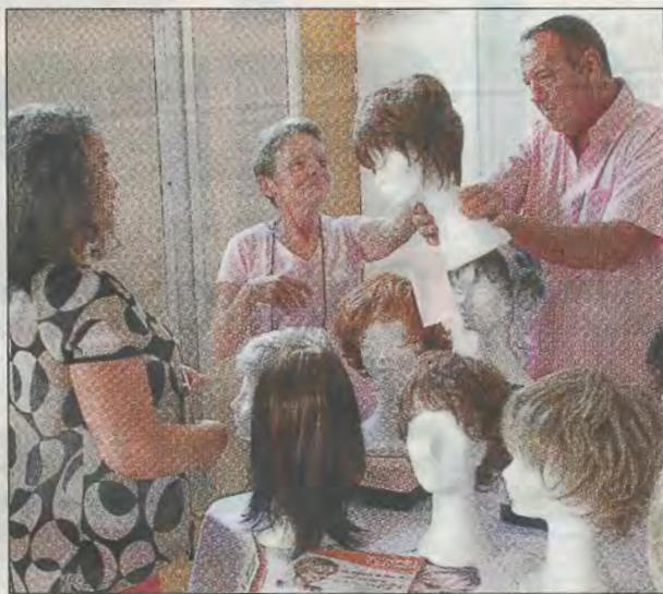
Les malades nécessitent aussi beaucoup de soins spécifiques, comme spécifié tout au long des 55 stands dont quatre perruquiers à l'espace Jean-Vilar, vendredi.

Affiner le diagnostic en allant voir plus finement les choses, telle est l'action du Tep-Scan que le